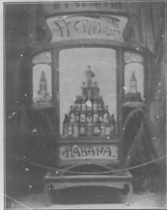
Presentación de los productos Licor de Berro y Aguardiente de Uva de Rivera en la Exposición de Camaguey. Obtuvieron dos medallas de oro.

Publicamos una vista de la misma, y reiteramos nuestra enhorabuena á los elaboradores de los ya popularísimos licores.