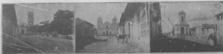
Iglesia del Cristo.-Convento de la Caridad.-Iglesia de Santa Ana.