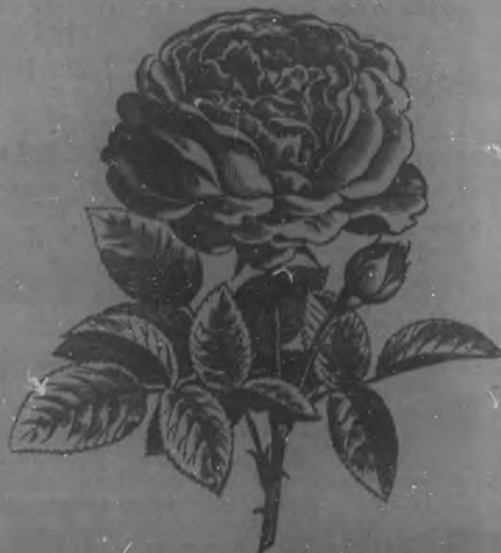
PERLA DE CUBA

La rosa blanca más linda propagada por el Jardín "El Clavel".