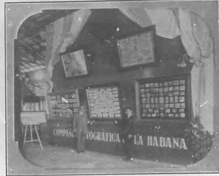
Presentación de la Compañía Litográfica en la Exposición de Camagüey.

Unas vistas de los distintos talleres completan esta rápida información que bien merece la Compañía que ostentando con orgullo "medalla de oro" de la Exposición de Buffalo, San Luis, París, y "gran premio" y "medalla de oro" en la Exposición Nacional de Cuba, ha concurrido al certamen de Camagüey en donde ha conseguido dos "medallas de oro". ¡Honor á la Industria Nacional aplicada al Arte!