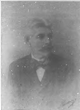
Graí. Gustavo Caballero.—Gobernador Civil en Camagüey.

CONFORME prometimos, al ocuparnos de la entonces en proyecto Exposición de Camagüey, hoy dedicamos toda la atención y todo el espacio á la que ha sido un magnífico exponente de la vitalidad de una región, y al mismo tiempo de confraternidad, pues á Camagüey han llevado y exhibido sus productos, industrias de la Habana, Santiago de Cuba, Guantánamo, Sagua la Grande, Gibara, Holguín, la colonia "La Gloria", Chaparra y Cárdenas. Hoy, al reseñar el triunfo de la Exposición, podemos adelantar que se prepara otra para el año próximo, que reina el mayor entusiasmo, y que se cuenta ya con cooperaciones eficaces y se espera la de los poderes públicos.