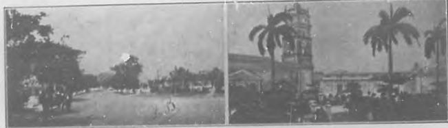
Casino Campestre.-Plaza de Agramonte.