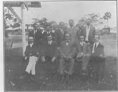
Grupo de representantes de Industrias que concurrieron á la Exposición de Camaguey.

Rendimos un tributo á varios representantes de casas que han expuesto sus productos en la Exposición de Camaguey, saluando á los que forman un blok que representa progreso y riqueza, y felicitándoles por los éxitos obtenidos en el concurso muy justamente merecido.