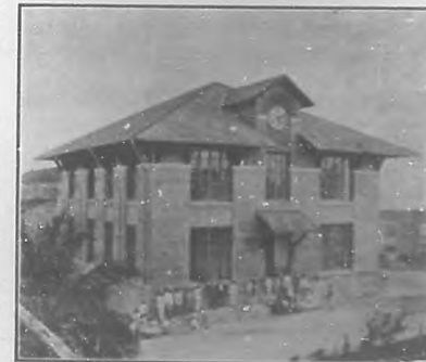
Escuela Pública "Aurelia Castillo", en Nuevitas (Camagüey).