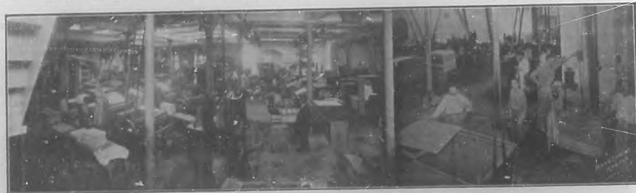
Talleres de la Compañía Litográfica.