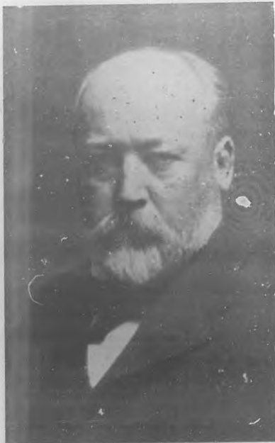
Sr. William Van Horn K. C. M. G. Presidente de la Compañía "Ferrocarril de Cuba".

La ciudad de Camagüey es una de las más beneficiadas por el Ferrocarril, debido á tener establecidos aquí sus talleres y oficinas principales. Actualmente tiene la Empresa 3.500 empleados y jornaleros y paga mensualmente unos $150.000.00 de sueldo. Pues bien, solamente en Camagüey viven unos 700 empleados entre oficinistas, mecánicos, maquinistas, carpinteros, jornaleros, etc. y