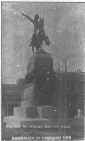
Monumento al General Ignacio Agramonte

Hecho por su autora en la velada que tuvo lugar en el Teatro Principal de Camagüey la noche del 26 de Febrero.